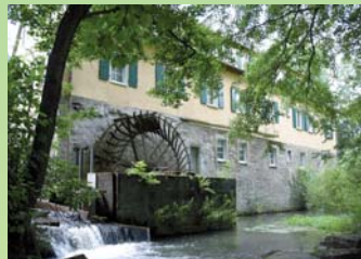
Reinharts- oder Volksmühle